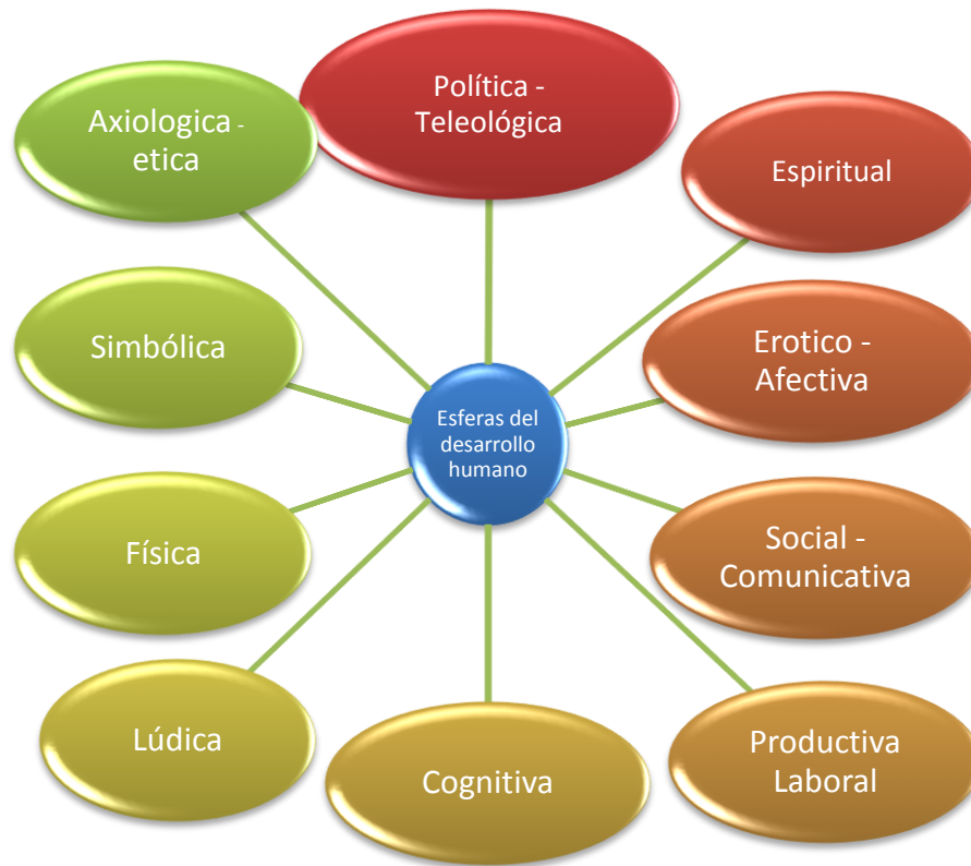
Figura 2. Esferas del desarrollo humano. Fuente. Las dimensiones que configuran lo humano en la educación y en la educación física de Bustamante y Sánchez.

Física no es ciencia pero sin duca crece y avanza esto se da gracias a que ya hace bastante tiempo posee sus propios medios y modalidades para perfeccionar los resultados obtenidos en su objeto de estudio, el hombre y su motricidad. (p.153 )