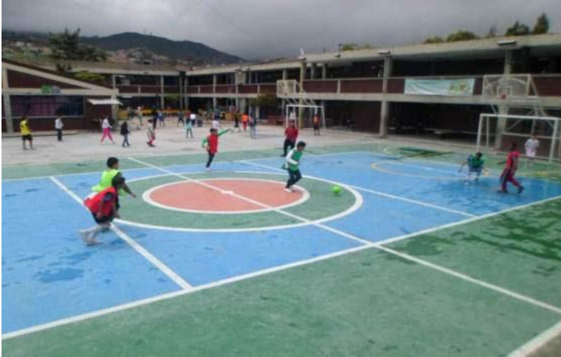
Figura 4. Fotografía planta física IED Almirante Padilla.