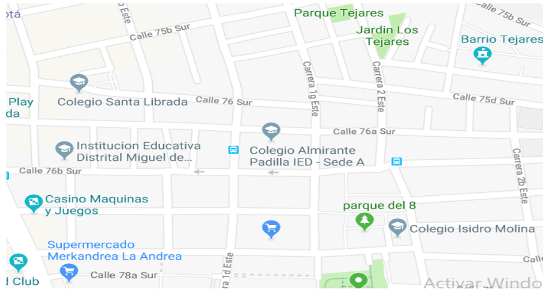
Figura 3. Ubicación IED Colegio Almirante Padilla. Zona quinta de Usme. Fuente: https://www.google.com/maps/@4.5121476,-74.1130464,17.04z

Se desenvolvía el plan “Para cerrar la brecha” bajo el gobierno de Alfonso López Michelsen, en el año 1978. Debido a la gran cantidad de niños que terminaban sus estudios primarios y debían desplazarse a colegios muy lejanos incluso fuera de la localidad, generó que en los habitantes del sector nacieran propuestas de intervención territorial para dar una educación a sus hijos más cercana, sin desplazamientos extensos y previniendo la inseguridad latente, pero solo hasta el siguiente año con el “plan de integración Nacional” los habitantes crearon el comité “proconstrucción del colegio” y en ayuda de algunos líderes comunales.