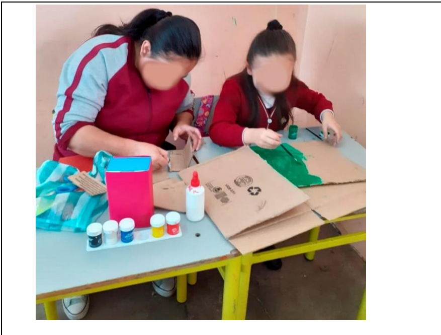
Imagen 8. Semana de la paz, curso 102

Fuente: Creación propia, 9 de septiembre de 2009 a las 10:30 am.