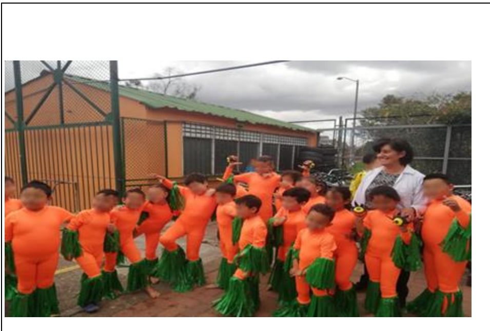
Imagen 5 Grupo de estudiantes y directora del curso 102

Fuente: elaboración propia, 7 de noviembre de 2019, 9:00 am.