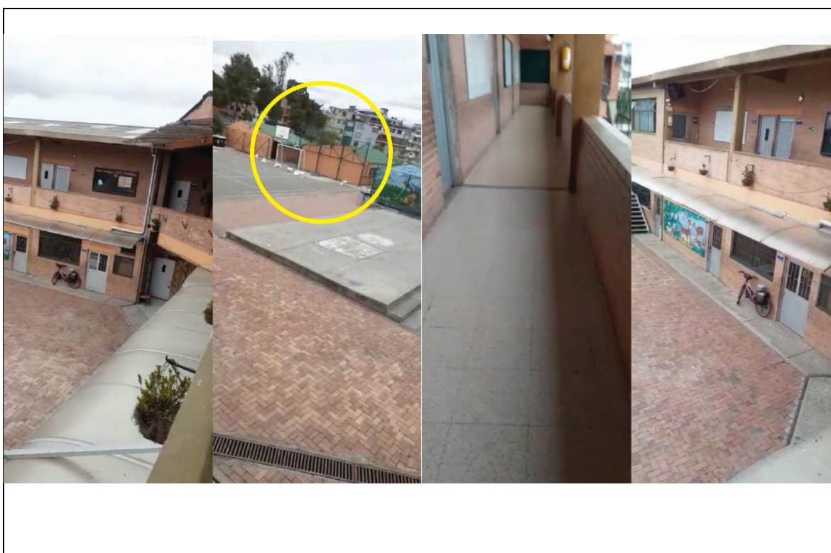
Imagen 4 Collage fotográfico de la institución.

Fuente: elaboración propia, 19 de febrero de 2020, 10:00 am