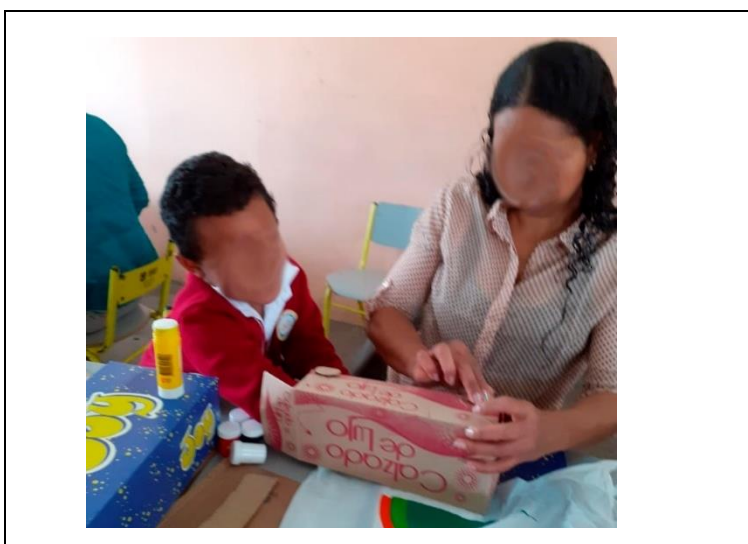
Imagen 7. Semana de la paz, curso 102