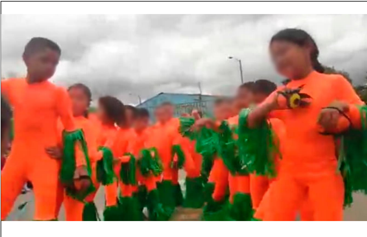
Imagen 9. Danza folclórica a cargo del grado 102.