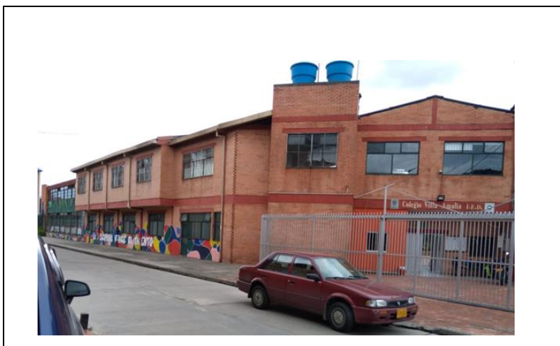
Imagen 3 Colegio Villa Amalia IED

Fuente: elaboración propia, 19 de febrero de 2020, 11:00 am