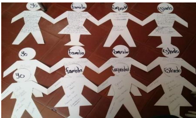
Fotografía 2: taller

Se resalta la importancia de la disposición de las familias de manera natural y tomarlo como una herramienta para aprender, comprender y crear una visión distinta de la vida. Se abordaron temas como las manifestaciones de la violencia intrafamiliar, situaciones de violencia en el territorio, las entidades creadas para defender los derechos y las sanciones pertinentes para proteger y prevenir las violencias, esta actividad permitió evidenciar el desconocimiento de las familias frente a las rutas de atención y la normalización de las violencias a las que están expuestas.