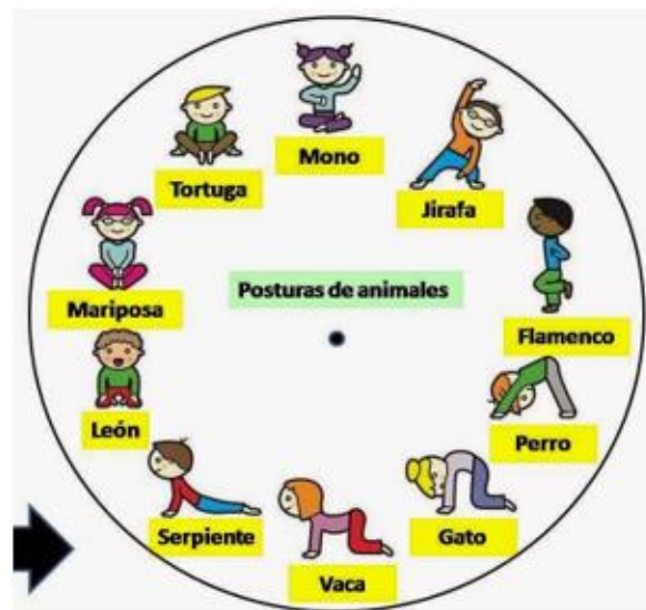
Ilustración 4: Posiciones de yoga con nombres de animales para calentamiento y estiramiento en los ensayos. . Tomado de https://i.pinimg.com/736x/aa/2b/ec/aa2beccfb47f8cf73a05995c89b18323.jpg

Cabe recalcar que paralelo a la realización de los ensayos, es importante realizar actividades para estimular diferentes partes del cuerpo y los sentidos cómo el yoga, pues se debe recordar que el cuerpo es el medio que permite el desarrollo y la construcción de todo lo que soy y lo que hago, esto en concordancia no solo con la obra y el personaje que interpreto, sino también con la vida misma.