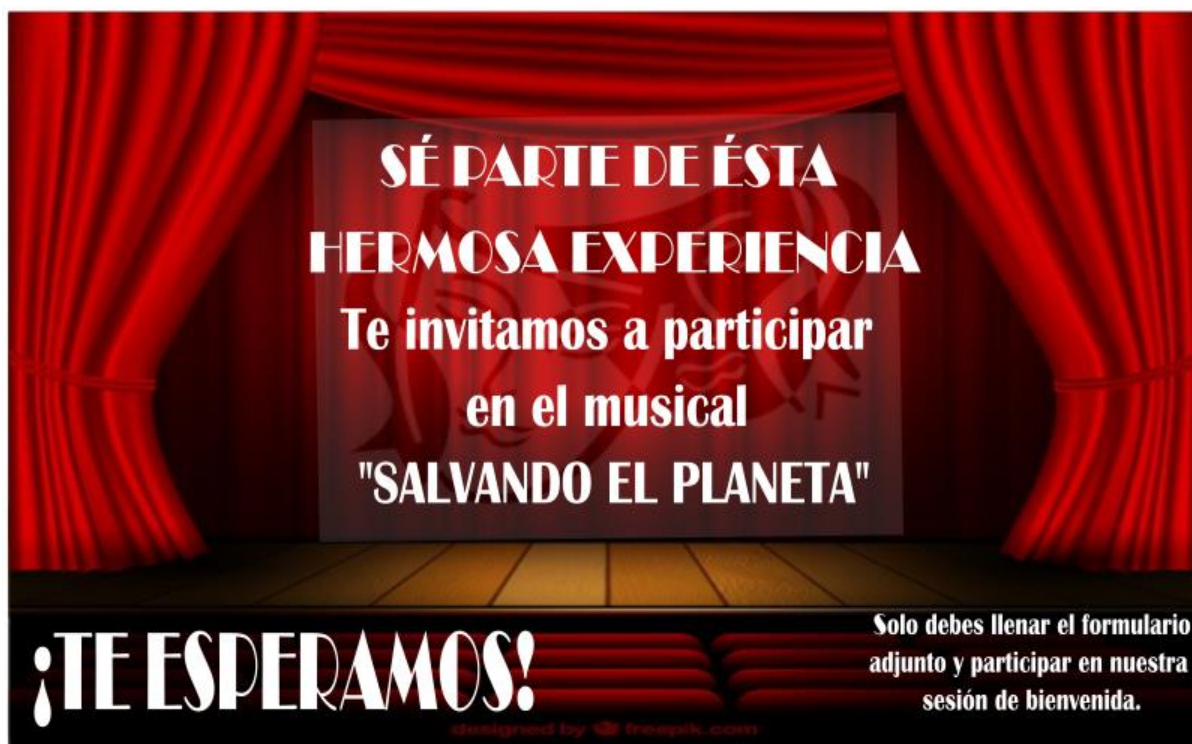
Ilustración 3: Poster de invitación para ser partícipe de la obra musical.

Hay que tener en cuenta que esta es una propuesta pensada para desarrollarse en el transcurso de 2 periodos escolares (4 meses aproximadamente), por lo que se recomienda la realización de 2 sesiones o incluso 3 sesiones por semana.