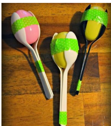
Ilustración 7: Maracas caseras.

Para este instrumento se usan dos cucharas de plástico, una pelota de ping pong de plástico; cinta adhesiva decorativa; algo para rellenar el hueco (legumbres, arroz, monedas,). Se toma la pelota de ping pong y se le realiza un agujero con ayuda de nuestros padres. por este agujero de introducen pequeñas cosas para generar el sonido.