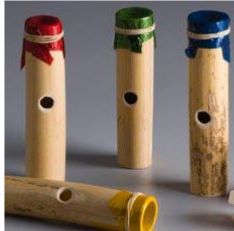
Ilustración 8: Kazoo casero.

Se hace uso de un tubo de cartón (puede ser de papel de cocina), papel celofán (10 cm x 10 cm) y una goma elástica. Se toma el tubo y se decora al gusto. Posteriormente se hace un agujero en el tubo, a unos 6 cm de uno de los extremos, se pone el trozo de celofán en el extremo del tubo más próximo al agujero se sujeta con la goma elástica y listo, se puede hablar o cantar (no soplar) por el extremo del tubo que ha quedado libre (Judith, 2015).