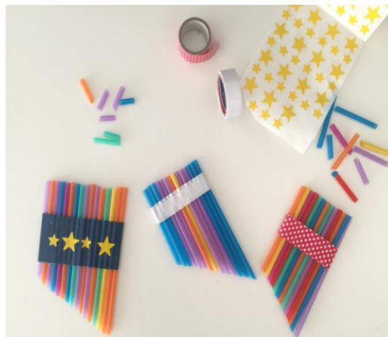
Ilustración 6: Flauta de pan casera. Tomado de https://mamay1000cosasmas.com/wp-content/uploads/2018/07/Flauta-de-Pan-4.jpg

Para realizar este instrumento se toman 9 pitillos de plástico y cinta. Se unen los pitillos con cinta y posteriormente se cortan de manera diagonal. (Judith, 2015)