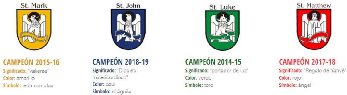
Ilustración 1: División de la comunidad del colegio San José, representada por sus 4 casas.

La comunidad estudiantil cuenta con 15 estudiantes en promedio por aula, trabajando los cursos desde kindergarten hasta high school incluyendo el grado 12, en donde se observan estudiantes en rangos de edad de los 4 a los 17 años 1 (Fonseca, 2020).