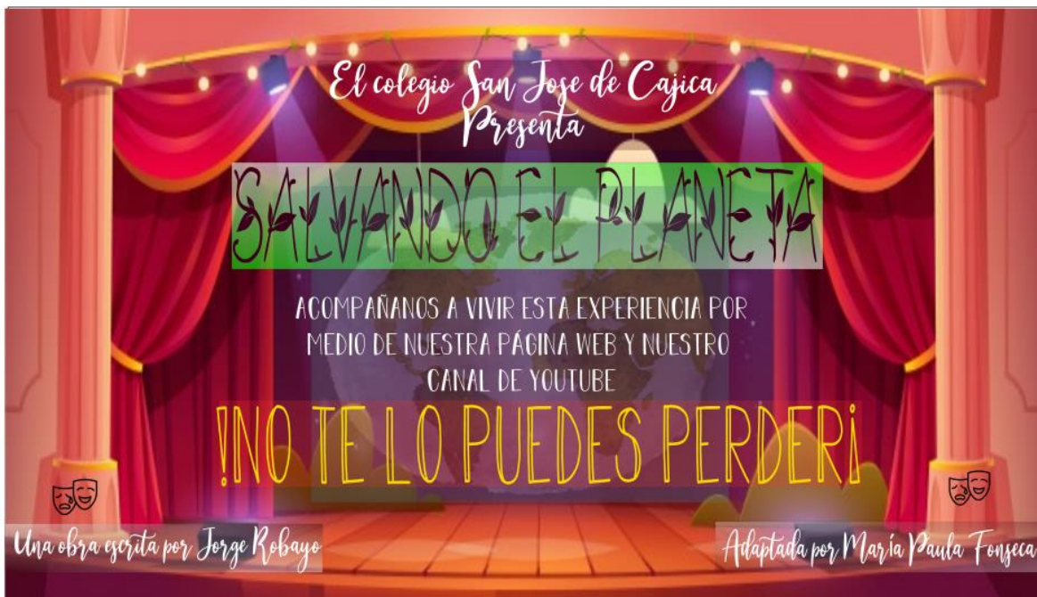
Ilustración 5: Invitación a ver la obra musical por medio de la página web y el canal de YouTube del colegio San José.

Para este momento se realiza un poster de invitación por medio de la página web del colegio, y posteriormente se sube el video a las plataformas virtuales (se recomienda usar el usuario de YouTube del colegio y/o la misma página web).