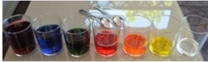
Ilustración 10: Xilófono casero. Tomado de

Para hacerlo más atractivo y para que se puedan diferenciar las notas, se puede poner un poco de