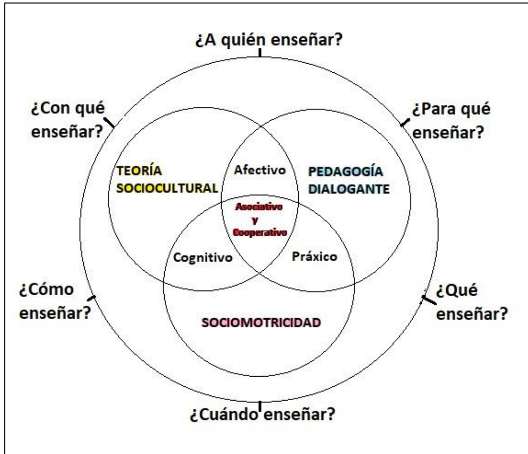
Figura 2. Relación gráfica de diseño curricular y constructo teórico.

Por lo tanto, dando respuesta se orienta el curso de esta propuesta educativa desde este enfoque curricular el cual es coherente con los objetivos, finalidad y problemática evidenciada. Siendo así se da respuesta a cada una de estas preguntas: