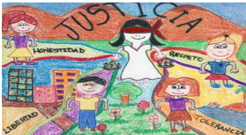
Imagen 3 Cartelera seleccionada sobre el valor de la justicia.

Para concluir, procedimos a elaborar carteleras con el propósito de que los niños y niñas expresaran la comprensión sobre el valor de la justicia y la equidad.