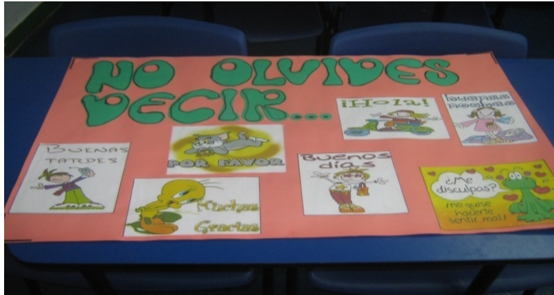
Fuente: Cartelera ganadora hecha por los estudiantes.