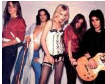
Figura 13. Foto de portada (h5)