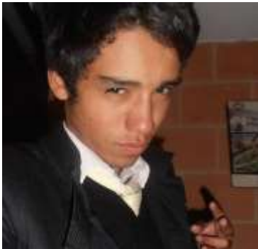
Figura 1. Foto de perfil h14

“ [...] que uno no tenga el maquillaje corrido, que uno esté bien presentado, porque uno debe mostrarse como es en la foto, tiene que estar bien”. (9F:127)