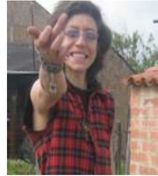
Figura 5.Foto de perfil (h19)