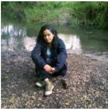
Figura 6.Foto de portada (m30)