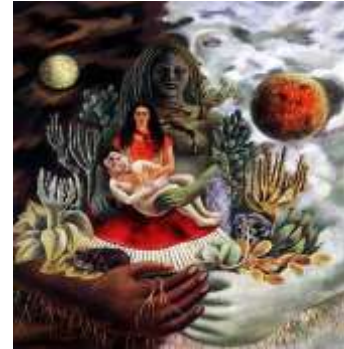
Figura 11. Foto de Portada (m4)