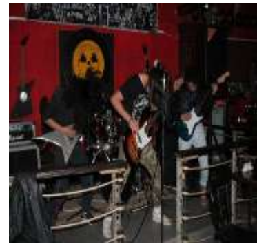
Figura 8.Foto de Portada (h23)

En las imágenes (m30, m28 y h23), todas fotos de portada, es evidente el interés por compartir la relación con los lugares a través de una actividad artística, deportiva y cultural. Los ambientes de las fotos (escenario, parque, naturaleza) reflejan las diversas formas de relacionarse con su entorno y con su propia corporalidad. En cuanto a los gestos y disposiciones corporales, se puede ver que el cuerpo asume posturas naturales derivadas de las acciones que están realizando, y que al mismo tiempo denotan la entrega por lo que se hace; tocar música, saltar en tabla y vivir un día con la naturaleza.