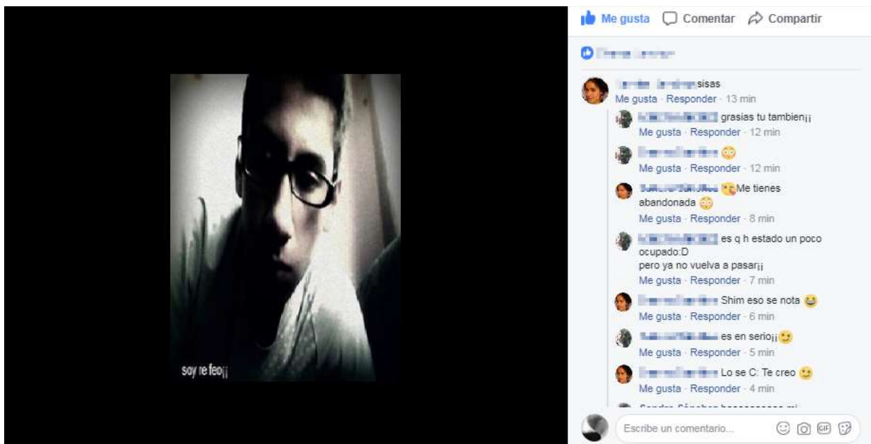
Figura 15. Foto de perfil (h11)

En Facebook, las imágenes cobran sentido porque existe la mirada del otro. Ese otro que completa la existencia de la imagen, de la corporeidad expuesta, porque logra conectar su ser y dialogar con aquello que le transmite. La interacción se ve reflejada en los comentarios y likes hechos a la imagen, incluso a las conversaciones que se puedan generar como se ve en esta imagen: