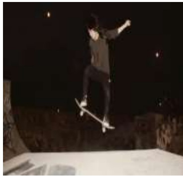
Figura7.Foto de portada (m28)