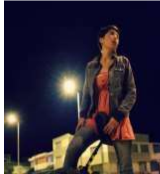
Figura 10. Foto de perfil (m20)