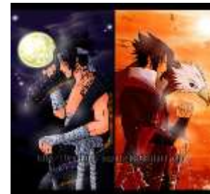
Figura 14. Foto de Portada (h15)

Para los jóvenes zipaquireños, Facebook es una posibilidad de compartir la forma en que se relacionan con el mundo, las elecciones que hacen a partir de lo que encuentran y cómo esas mismas elecciones trastocan sus vidas, transformándolos y al mismo tiempo siendo transformadas por lo jóvenes, dejando ver la relación quiasmática planteada por Merleau-Ponty mencionada anteriormente. Con respecto a esto, los jóvenes comentan que desde Facebook suceden cosas que modifican su cotidianidad.