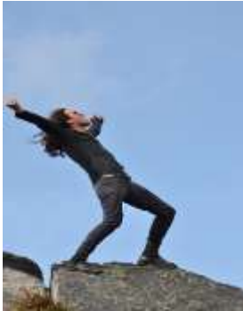
Figura 9. Foto de perfil (h27)

Así, las imágenes que corresponden a FPA dan cuenta de los intereses y gustos de los jóvenes, expresados a través de figuras públicas, películas, objetos, deportes, obras de arte, música, teatro, frases, animales, avatares y paisajes. En las imágenes que son de portada, se presentan; grupo musical (h5), obra de arte (m4) y avatar (h15). En las fotos de perfil (h27), y (m20) se presentan los jóvenes compartiendo sus gustos por diferentes actividades para este caso; el encuentro con la naturaleza y la relación con el monociclo.