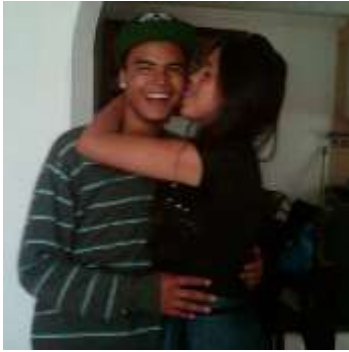
Figura 3.Foto de perfil (m3)