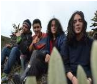
Figura 12. Foto de portada (h29)