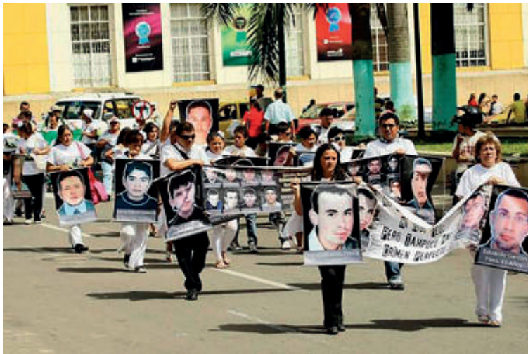
Figura 10. Marcha en Bucaramanga