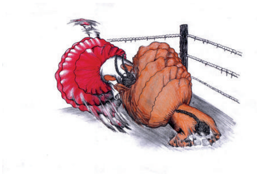
Figura 25. Faldas Torbellino