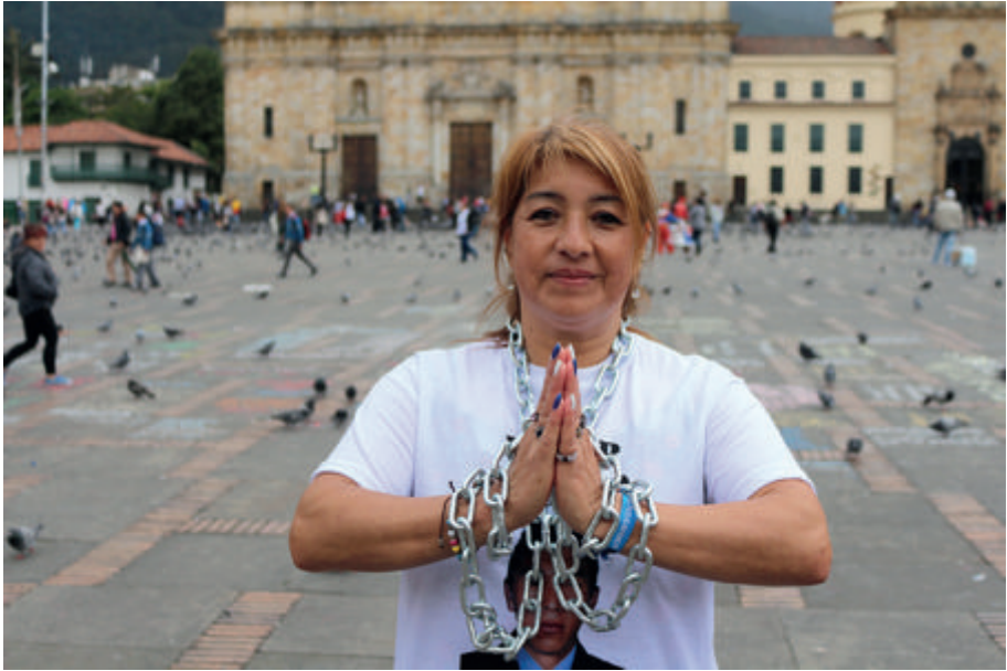
Figura 13. Reunión en la plaza de Bolívar