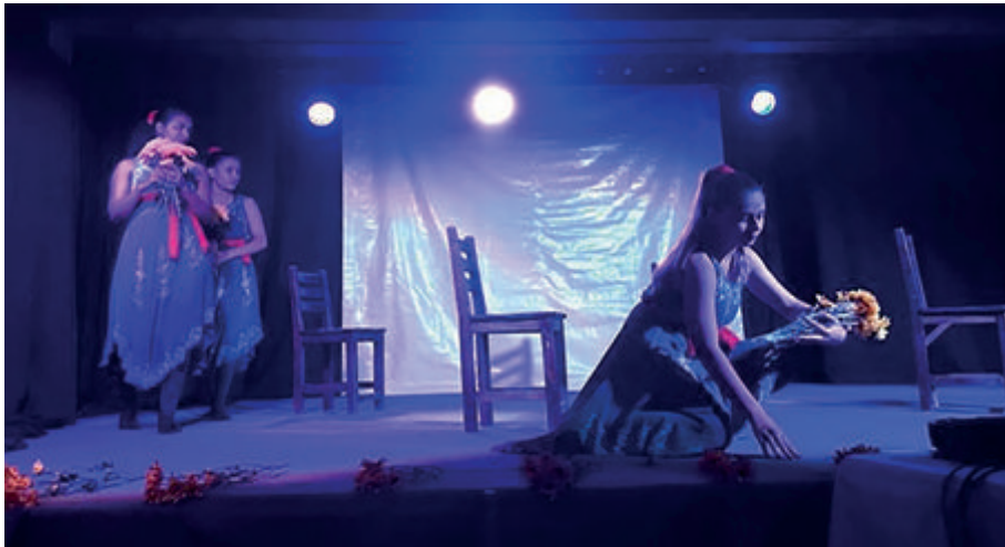
Figura 24. Obra teatral Historia con ojos de mujer

Para cerrar la secuencia, y con el objetivo de articular lo abordado y aprendido, proponles a tus alumnos centrar su atención en acciones sociales o comunitarias dirigidas a paliar o superar el desplazamiento forzado. La idea es que ellos mismos identifiquen y hagan visibles acciones pacíficas realizadas por organizaciones como la OFP (Figura 24). Destaca que la búsqueda y la construcción de la paz