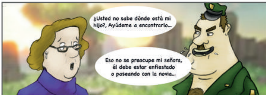
Figura 5. Historieta sobre la Asociación Caminos de Esperanza Madres de la Candelaria. Memorias