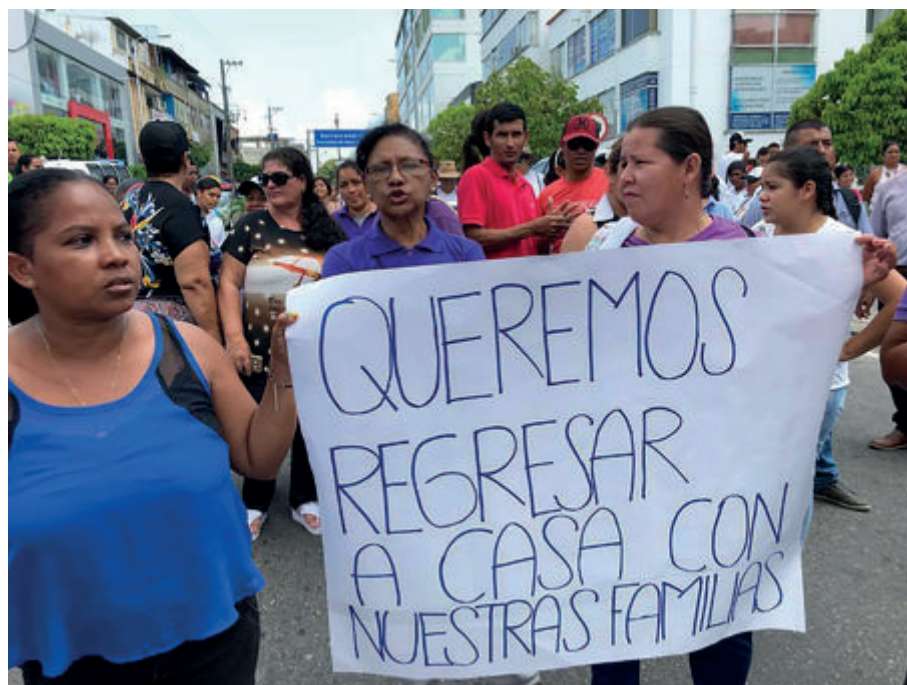
Figura 15. Queremos regresar a casa