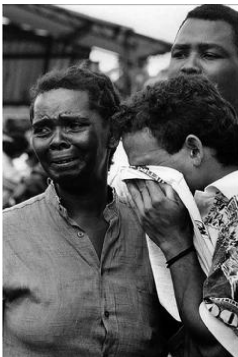
Figura 29. Familiares de víctimas de una masacre guerrillera, Apartadó, Urabá