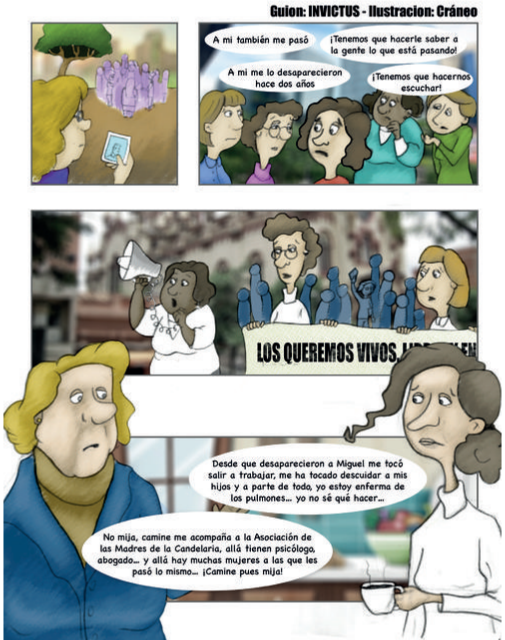
Figura 6. Historieta sobre la Asociación Caminos de Esperanza Madres de la Candelaria. Memorias