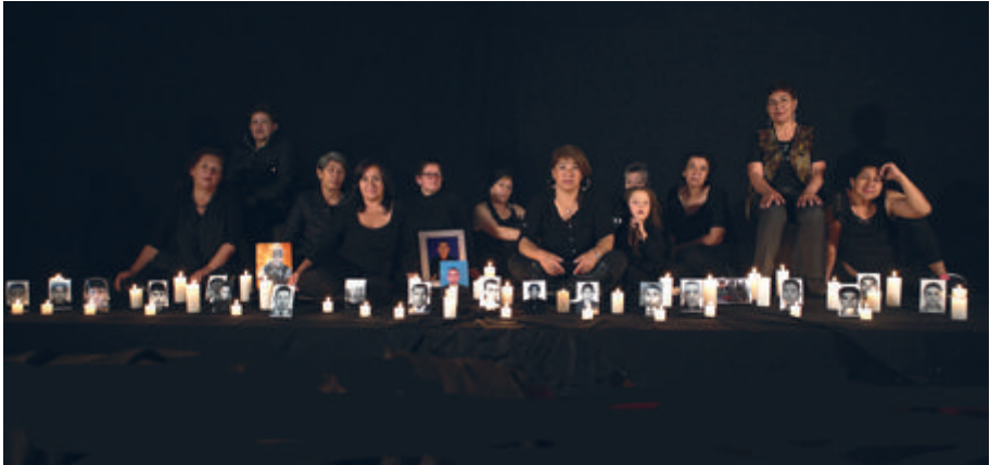
Figura 14. Proyecto fotográfico Ausencia