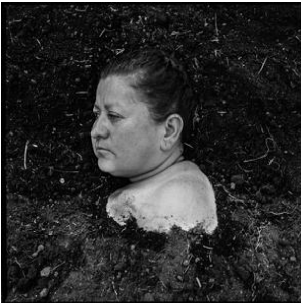
Figura 12. "Madres Terra"