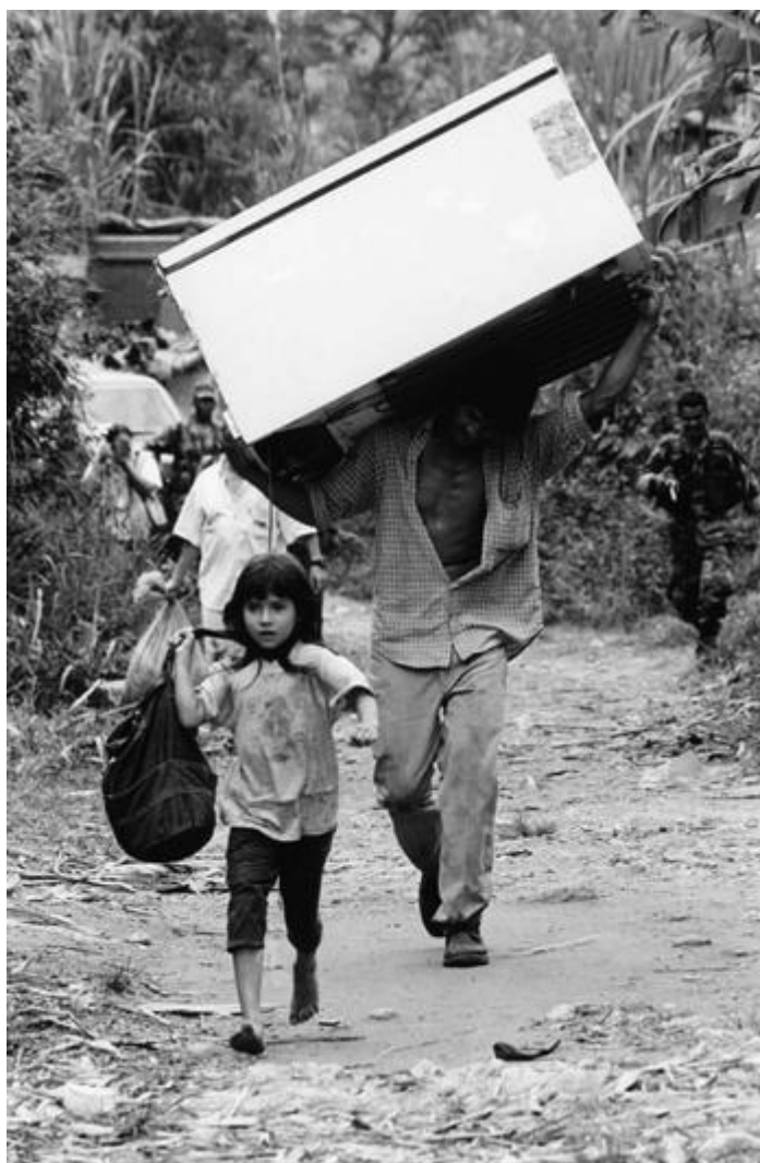
Figura 16. Desplazamiento tras la masacre de las Farc en la vereda La Tupiada en San Carlos, Antioquia

Imagen de tonos bíblicos, de un éxodo campesino en San José de Apartadó, luego de una matanza perpetrada por paramilitares, con la colaboración del ejército (Figura 17).