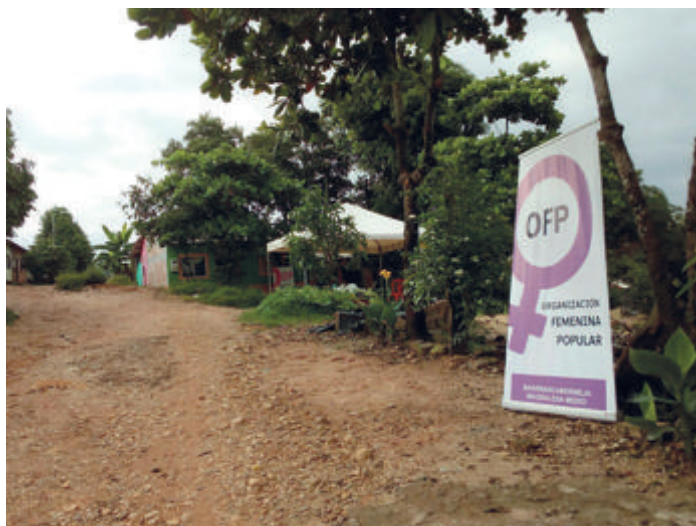
Figura 23. Camino de Barrancabermeja