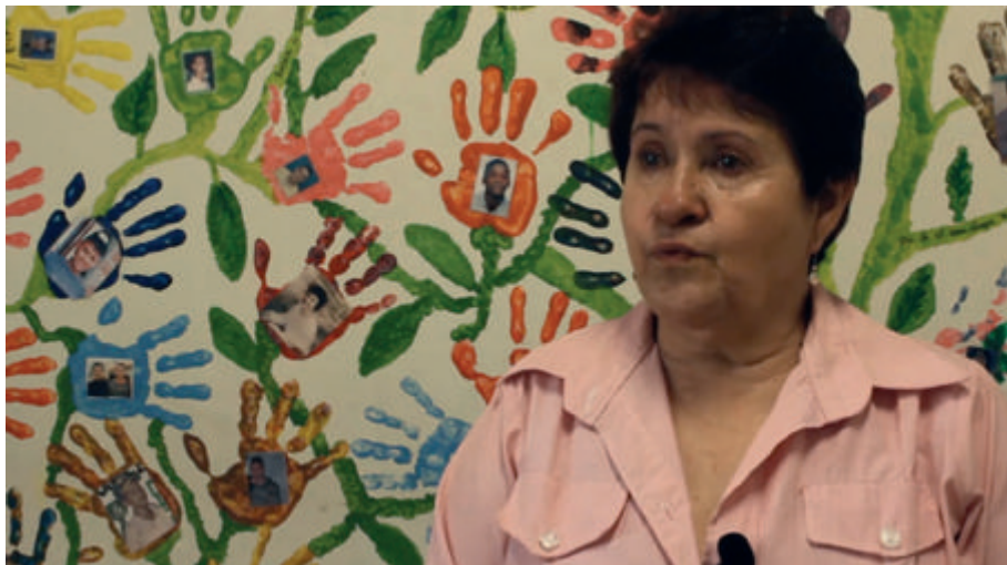
Figura 4. Lo que causa, en mí, no saber de ti