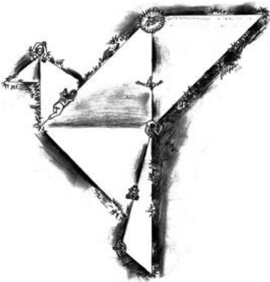
Figura 31. Paz de origami