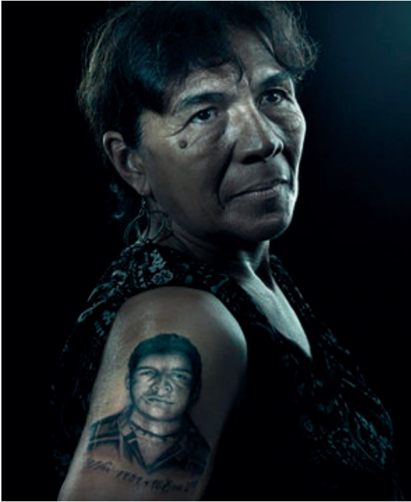
Figura 11. Nunca más