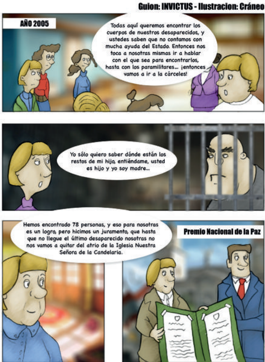
Figura 7. Historieta sobre la Asociación Caminos de Esperanza Madres de la Candelaria. Memorias