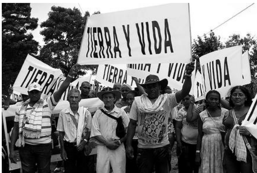
Figura 18. La tierra en disputa