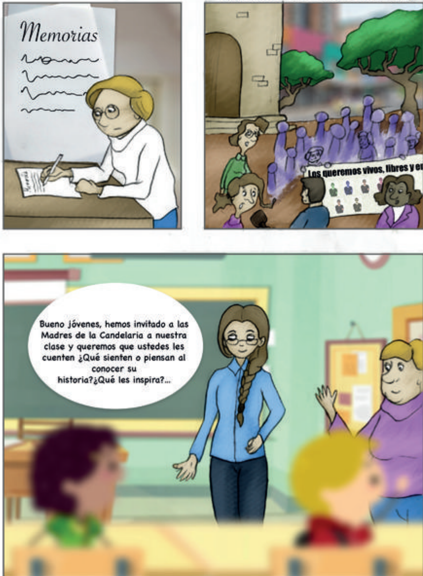
Figura 8. Historieta sobre la Asociación Caminos de Esperanza Madres de la Candelaria. Memorias