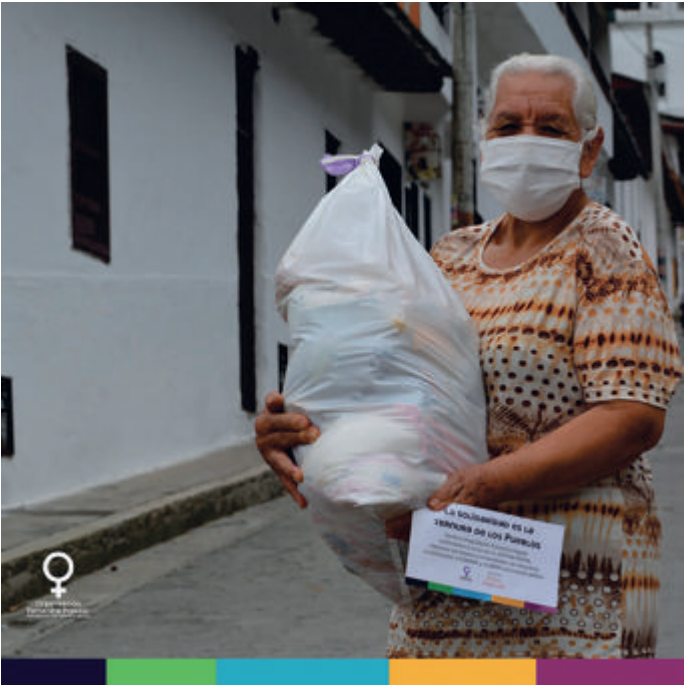
Figura 21. La solidaridad es la ternura de los pueblos