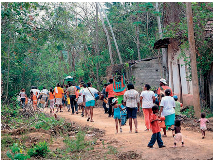
Figura 19. Imágenes para la memoria