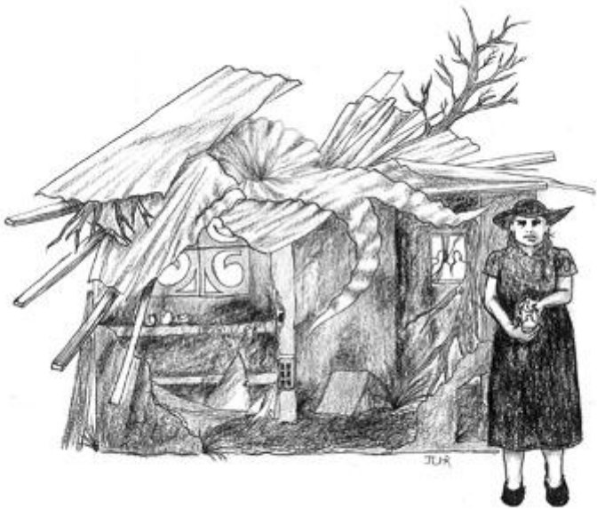
Figura 28. Lo que queda