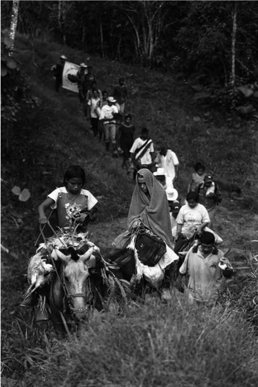
Figura 17. Éxodo campesino en San José de Apartadó