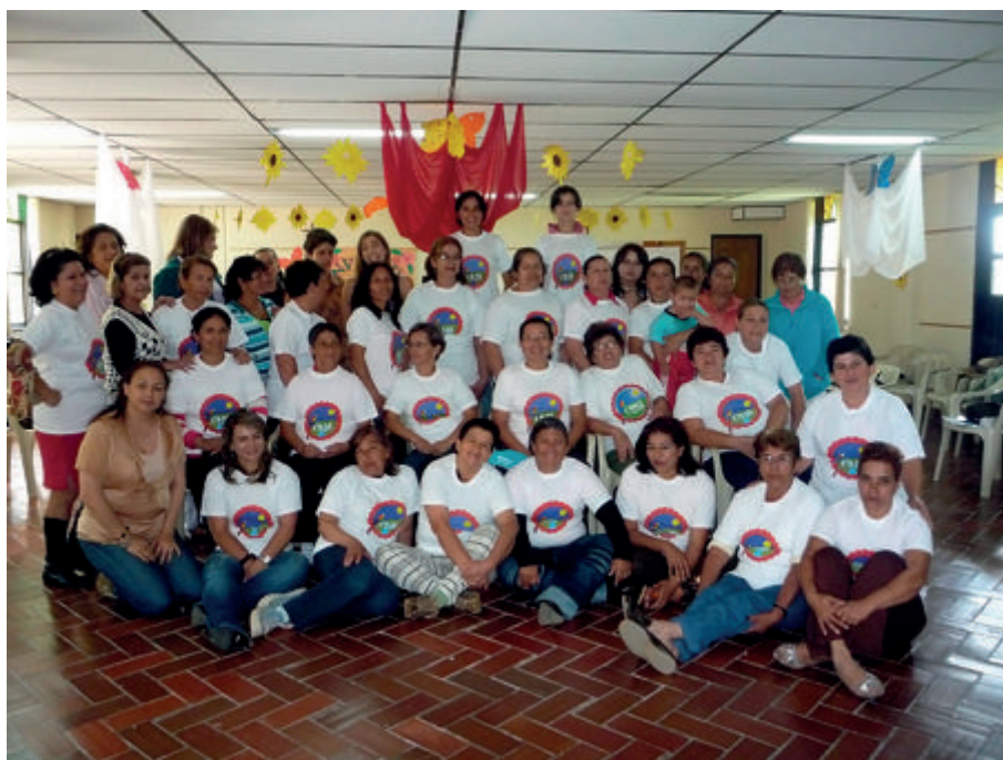
Figura 30. Grupo de mujeres de la organización AMOR

Cuando AMOR inició, inició con tres propósitos, que eran: uno, transformar la cultura patriarcal, dos, buscar y acompañar a las mujeres en el paso de la casa a la plaza, o sea, que las mujeres pasaran del espacio privado al espacio público y el tercer objetivo era que se vincularan las mujeres al desarrollo, que hicieran parte del desarrollo de sus comunidades.