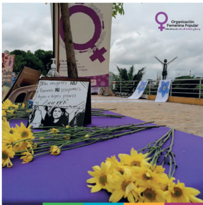
Figura 22. Homenaje a las víctimas