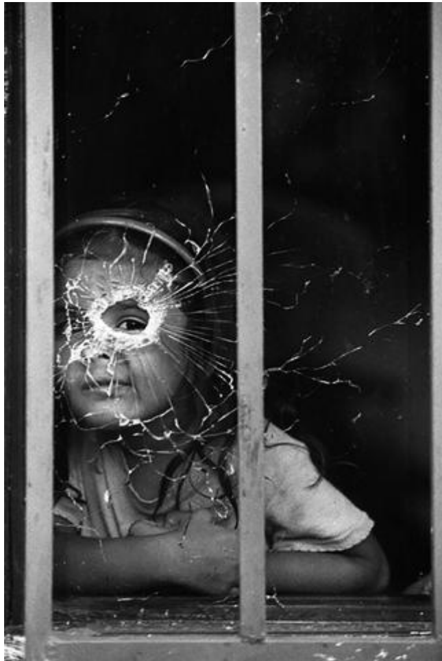
Figura 26. Barrio La Independencia, Comuna 13, Medellín