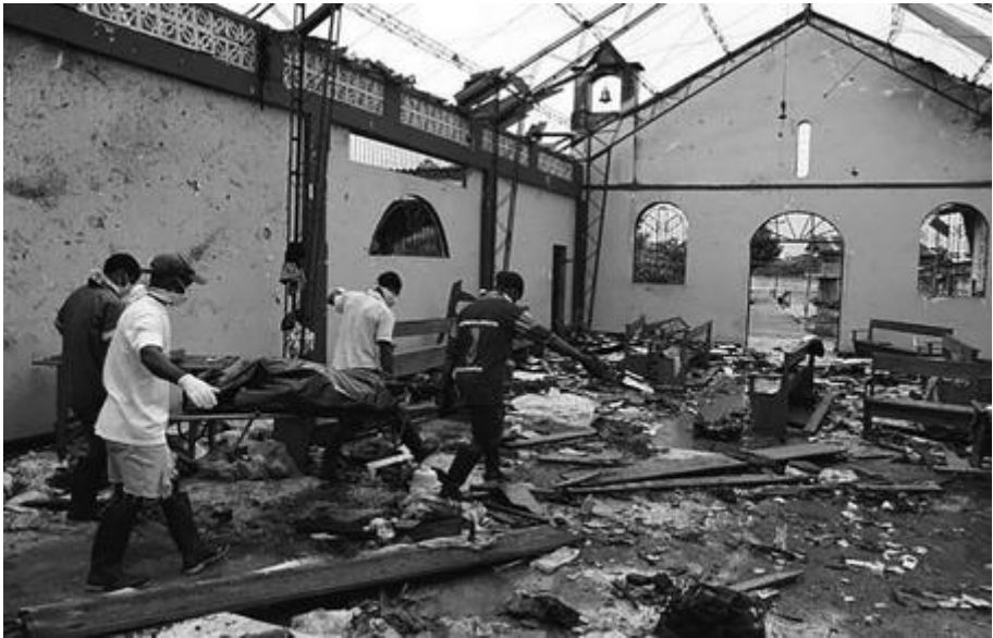
Figura 27. Víctima de un ataque de la guerrilla a una iglesia en Bojayá, Chocó