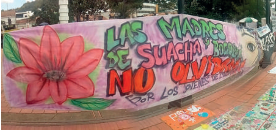
Figura 9. Conmemoración de los cuatro años de las ejecuciones extrajudiciales de los jóvenes de Soacha y Bogotá

Para dar cierre a la sesión, pídeles a los representantes de los subgrupos que socialicen en plenaria el trabajo realizado. Destaca los principales aportes de tus alumnos y describe los eventos que corresponden a cada imagen, según la información proporcionada a continuación: