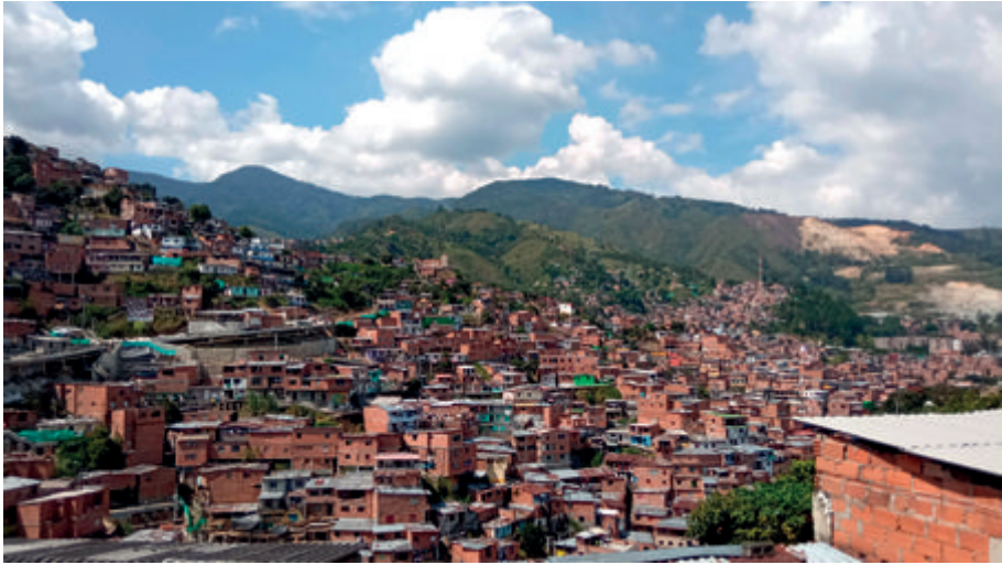
Figura 20. Medellín, Comuna 13