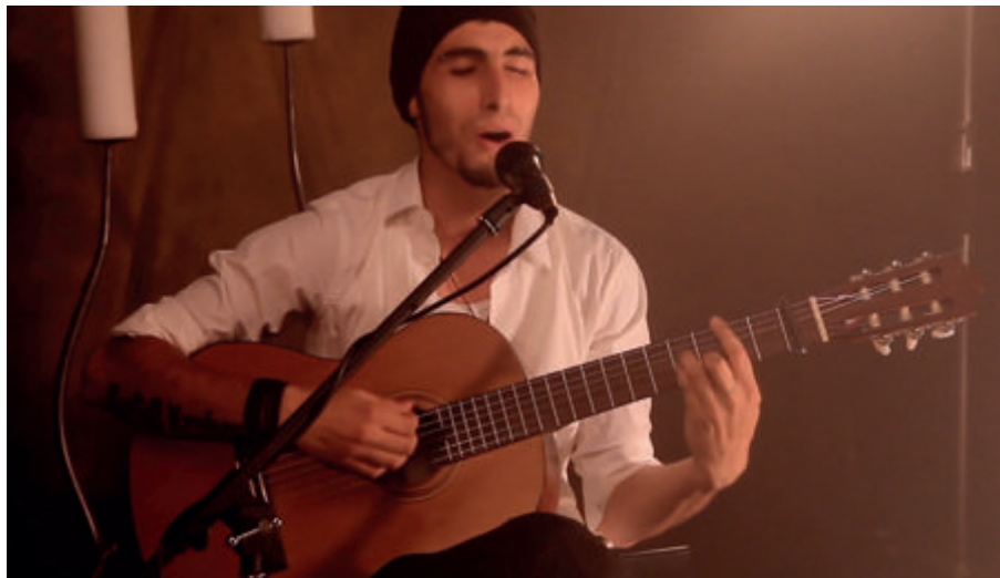
Figura 2. KoGgi Kroker, Un tranquilo adiós

Luego de haber realizado el dibujo, dispón al grupo para escuchar la canción Un Tranquilo Adiós , del cantante KoGgi Kroker (mediante cualquier reproductor de sonido), y entrega una copia de la letra de esta a cada uno de tus alumnos.