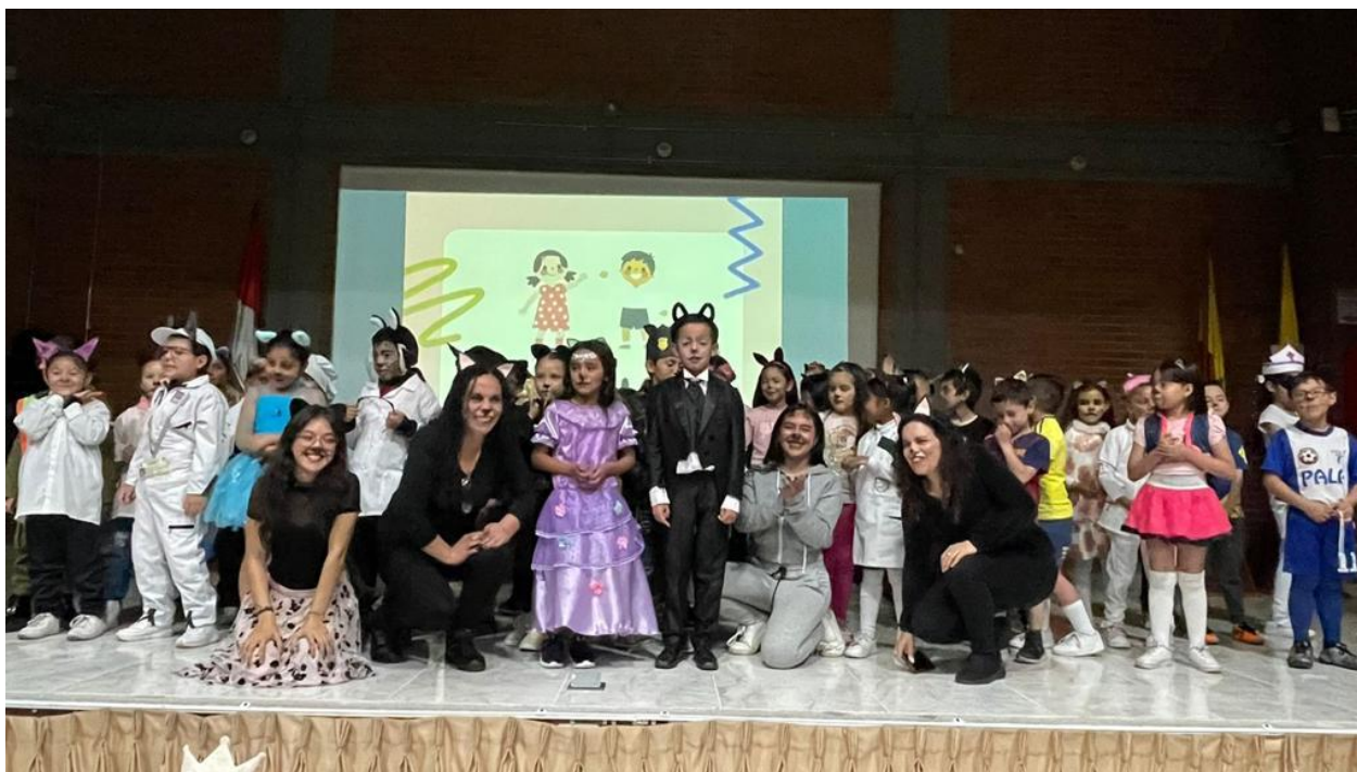
(Imagen # 4 Presentación Final)