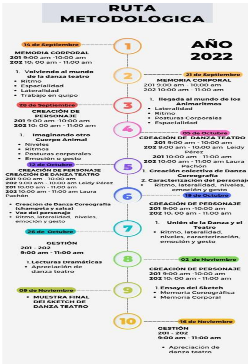
(Imagen #2, Infografía)

Es importante resaltar que la infografía es una herramienta que facilita el repaso y la ampliación de los contenidos, pues se utiliza como un recurso didáctico para estructurar el desarrollo de las sesiones, asimilando y procesando la información que se trabaja desde los puntos de vista de los estudiantes y nuestro rol docente.