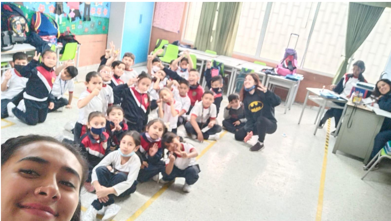
(Imagen #5 y #6 Evolución del bus gato)

Canción del invierno: Este material didáctico tiene como objetivo principal reconocer el espacio, partiendo de la idea que se va a acabar con el invierno del mundo al que se viaja, esto se realiza cantando una canción creada por las docentes en formación, desde un referente en rondas infantiles (alegra,2022), que está acompañada de algunos movimientos corporales que indica la canción, además se camina por el espacio en líneas curvas y líneas rectas, en varias velocidades y con las lateralidades (derecha e izquierda), fomentando de esta manera la imaginación y la creatividad de los estudiantes.