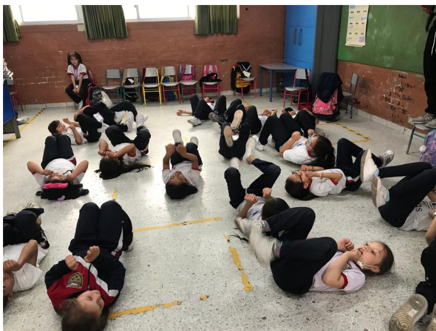
(Imagen #15 Corporalidades gatunas)

Pasarela Gatuna: En este juego se da el espacio para implementar todos los gestos, movimientos, y corporalidades implementadas en el juego anterior. Este juego también se ejecuta desde una exploración musical, pues trata de una pasarela gatuna donde cada estudiante pasa por un camino mostrando los resultados de su exploración al resto de sus compañeros y a las docentes en formación.