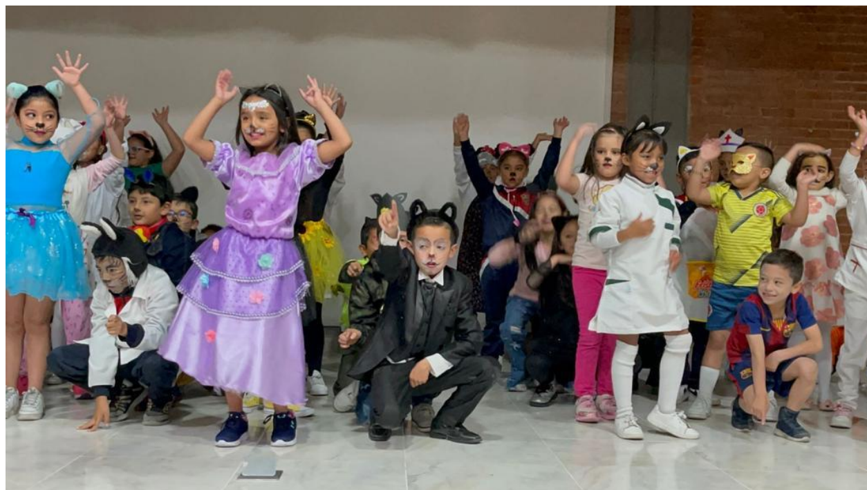
(Imágenes de presentación fina, adaptación del cuento “Una noche y un gato”)