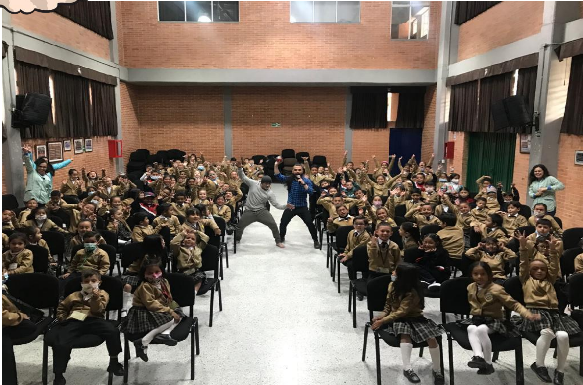
Imagen 3 (nombre de la imagen. “contexto”)