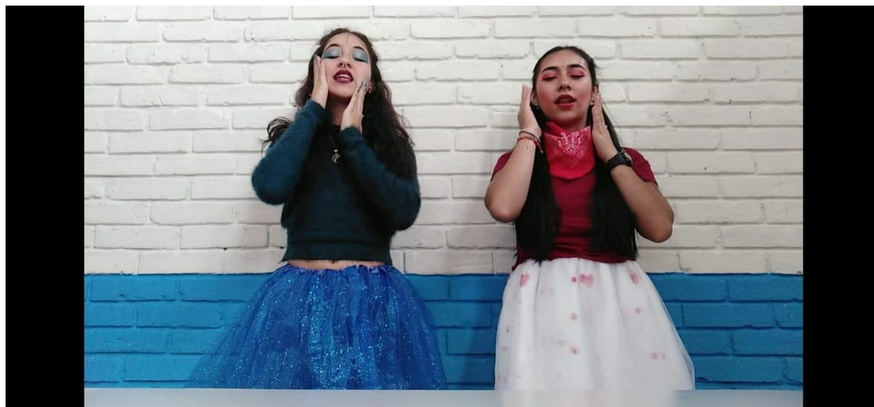
(Imagen #9, Diestrilla y Zurdilla)

El mundo y sus lados: Este juego de lateralidad comienza cuando las docentes en formación dibujan una carita feliz Roja en la mano derecha y una carita feliz Azul en la mano izquierda, esto con el fin de que los estudiantes logren diferenciar y reconocer cuál es su lado derecho e izquierdo. Luego los estudiantes se ubican en un círculo donde se les da varias indicaciones para que ellos las sigan (Levanten la mano derecha, luego la izquierda, caminamos hacia el lado derecho e izquierdo, etc...) y de este modo se desarrolla el juego con un ritmo activo.