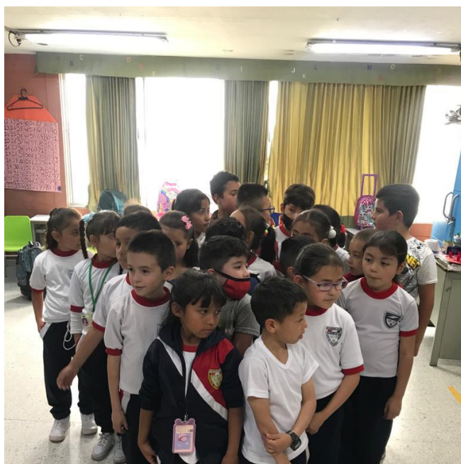
(Imagen #20 y 21 creación persecución gatuna)

Fase 4: En esta fase se fusionan los dos equipos convirtiéndose en uno solo, este equipo tendrá el objetivo de perseguir a los gatos protagonistas sin que ellos se “den cuenta”. En esta escena los gatos protagonistas caminan por el espacio y el cardumen de estudiantes los sigue. Cuando los gatos miran al cardumen, estos tendrán que quedarse congelados, así de esta manera no los ven.