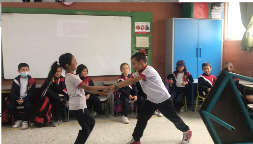
(Imagen #22 y 23)