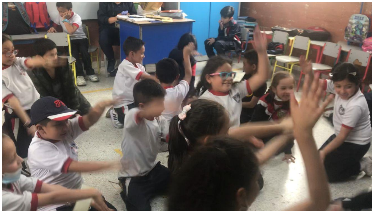
(Imagen # 14, Canción de cocodrilo)

Ni un gato, ni un topo, ni un elefante loco.