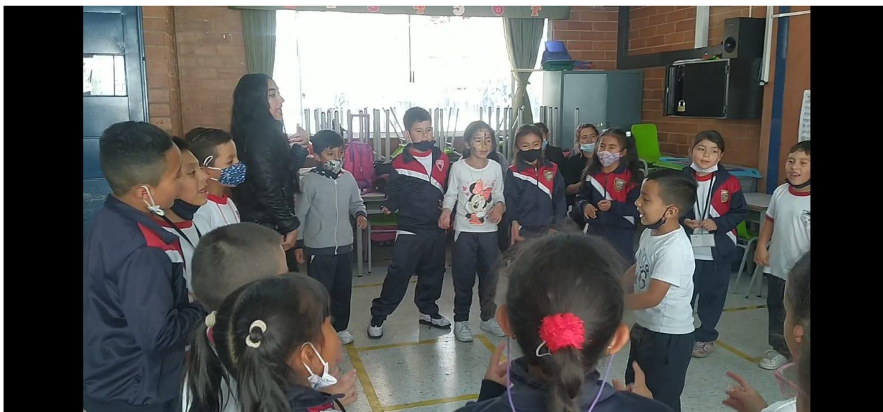
(Imagen #10 Juego un duende escondido)

ellas escojan tiene que levantarse, correr en la dirección que se les ha indicado, tocar un objeto y devolverse corriendo a sentarse de nuevo en su puesto.