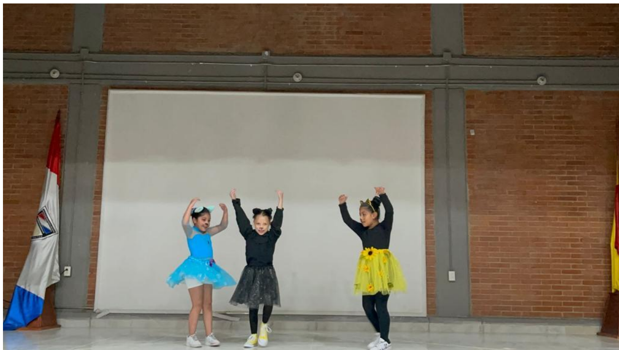
(Imagen #16 y 17 Profesiones Gatunas)

Socializando mi profesión: En este ejercicio de creación los estudiantes se ubican en filas y cada equipo pasa al centro a mostrar su Boomerang, mientras que el resto observa el ejercicio desde sus personajes. Este juego se hace con la intención de fortalecer la escena #2 puesto que se configura el espacio tal cual será en el performance final.