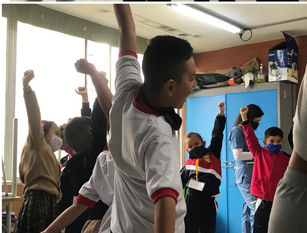
Imagen 7 y 8 Canción del invierno