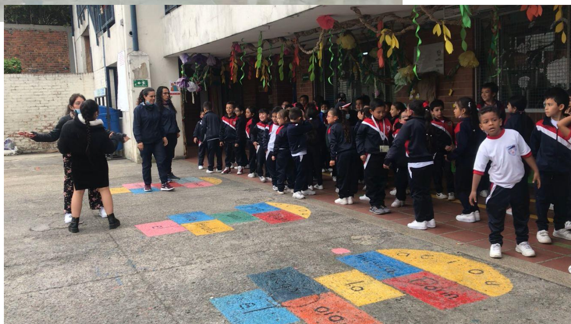
(Imagen # 24 y 25 Creación y Muestra final de la fiesta de los gatos)