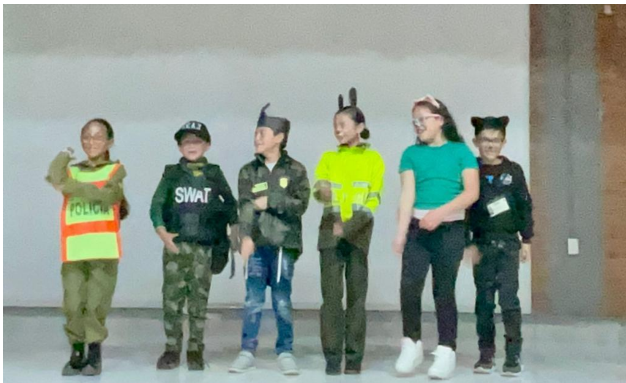
(Imagen # 18 y 19 proceso de creación y presentación final profesiones gatunas)

Persecución Gatuna: Este ejercicio de creación se divide en distintas fases, con el objetivo de crear un cardumen con los estudiantes para la escena # 4