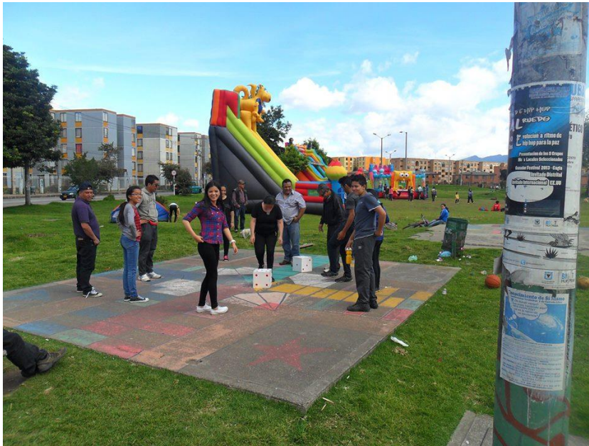
Juegos de mesa pintados en las plazoletas del Parque

En una de las tomas territoriales que se realizaron, sucedió un hecho impactante para el colectivo pero que a su vez fortaleció su unión. Estando en desacuerdo con el concepto clásico de recreación, surgió la iniciativa de la Revolución