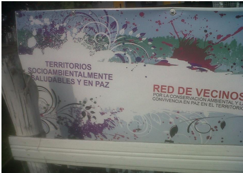
Huerta Urbana heredada por los vecinos del parque Piloto

Fue entonces cuando resolvieron tomarse los parques de la localidad sin ningún tipo de consentimiento o autorización. Antes bien, se partía de la iniciativa de ver el parque como el ambiente donde cada persona podía