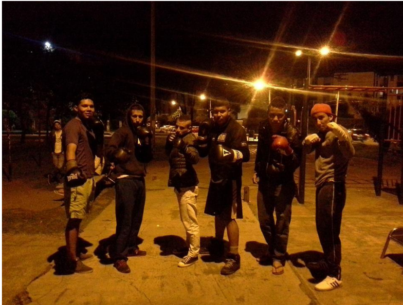
Boxeo en el Parque Piloto

pues estos no volvieron, algunos aguantaron otros no y la gente se dispersó porque consideraron esta situación como un sabotaje de la institución hacia el proceso de caoss". 7