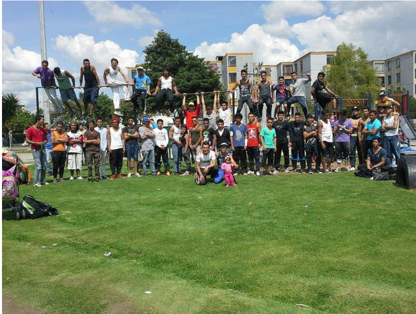
Jóvenes de la Comunidad del parque piloto, realizan ejercicio en las barras instaladas por CAOSS

popular e investigadora Social a nivel Latinoamericano. Dichas conferencias propiciaron discusiones que llevaron a encontrar las necesidades educativas en el territorio, estas cátedras fueron la plataforma que llevó a caoss a realizar posteriormente cada actividad pedagógica.