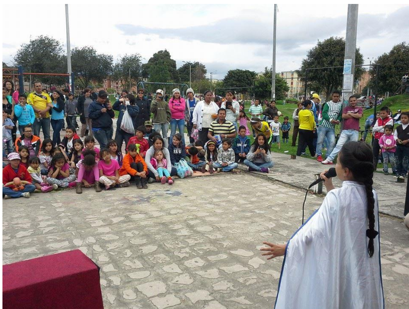
Niña de la Comunidad Declamando en las vacaciones recreativas