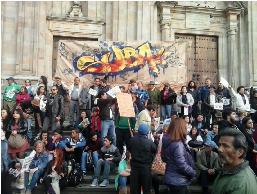
Movilización Por los Derechos Políticos

Otro de los hechos que algunos miembros refieren como un intento externo de politización fue la movilización a favor de los derechos políticos del entonces Alcalde de la ciudad de Bogotá, Gustavo Petro Urrego, no obstante más que una situación de