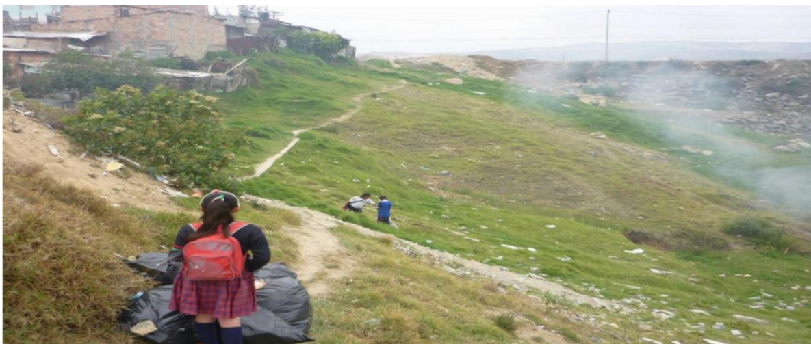
Imagen tomada martes 3 de septiembre del año presente- Actividad programada “Limpieza del Humedal “– Palo del Ahorcado – Altos de Cazucá

“La crisis del desplazamiento cada vez es más compleja, no se cuenta con las redes sociales que permitan el restablecimiento de la población, la zona no cuenta con la infraestructura necesaria ni con planes orientados a la atención de esta problemática. Estas familias se demoran en restablecer su vida, dado que la asistencia del estado es prácticamente inexistente, lo que conlleva que ellos tengan que subsistir por medio de subempleo. Algunos logran ventas callejeras, otros se dedican a la mendicidad, no encuentran cupos educativos y el acceso a la salud es cada vez más difícil para ellos. Las ayudas son muy pocas y cada vez se restringen más, además de esto, no hay un sistema informativo que les permita ubicar soluciones temporales.” 6