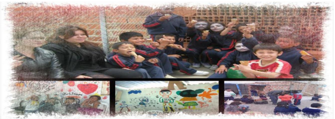
Fotografía tomada del proyecto reconstruyendo la alegría, la escuela y la niñez, 2013 – 1