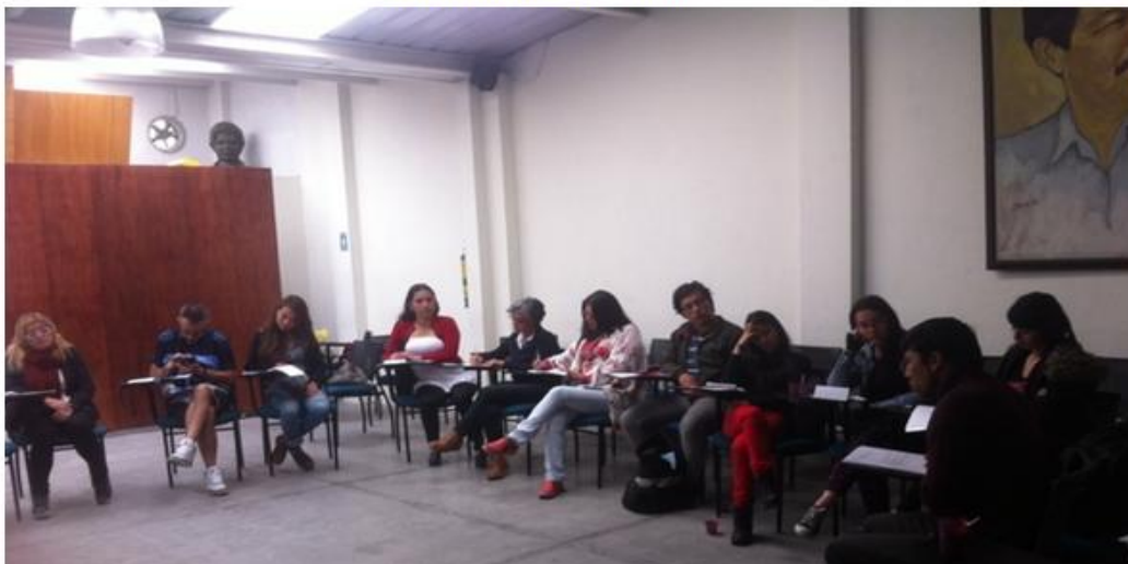
Socialización del trabajo

Foto sobre: Escuela cívico popular, socialización del trabajo sobre POT, 12 de septiembre del 2015