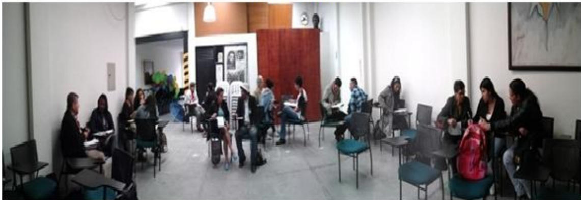
Foto: Escuela cívico popular, 12 de septiembre del 2015

La ejecución del ejercicio propuesto en la cartilla hace referencia a identificar una problemática territorial y la elaboración de un plan para establecer una solución viable. La actividad empieza con organizar a los asistentes de la escuela por sus grupos de trabajo según las organizaciones sociales de las que son miembros y se les pide hacer un dibujo de su territorio (este dibujo es un esquema o mapa del lugar donde ejecutan su trabajo como organización). Luego se les pide que dentro del dibujo especifiquen lugares de encuentro o reunión y sitios de relevantes como por ejemplo, casas comunales, lugares comerciales, parque etc.