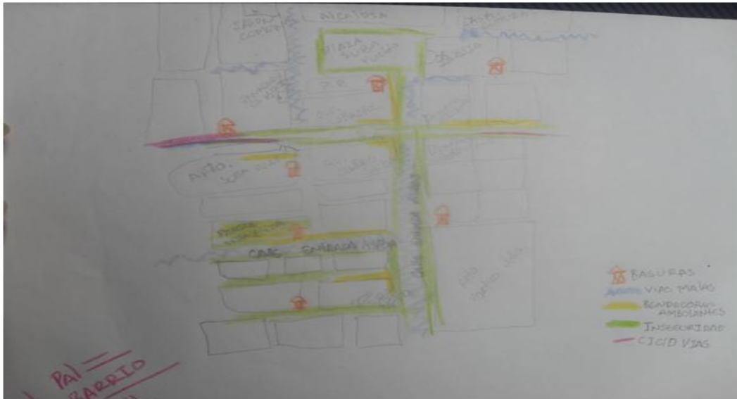
Dibujo en forma de plano zona Suba

Fotografía: dibujo del ejercicio de planeación, elaborado por los participantes del colectivo Suba Nativa, escuela cívico popular 12 de septiembre del 2015, tomada por Yasmin Ávila, docente de apoyo UPN.