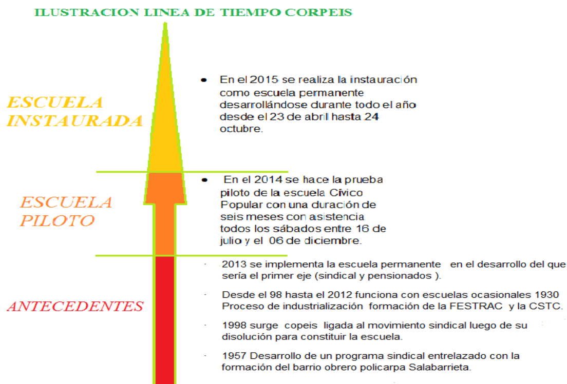
Ilustración 1 línea de tiempo

Línea de tiempo elaborada por: Yasmin Ávila, docente de apoyo UPN.