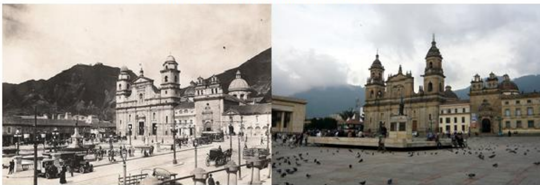
Plaza de Bolívar, Bogotá, Colombia.

(A la izquierda, foto Plaza de Bolívar 1920. A la derecha foto Plaza de Bolívar 2015)