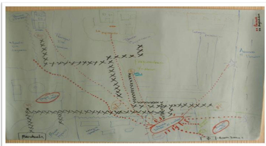
Figura 1: Relaciones y dinámicas en el territorio.