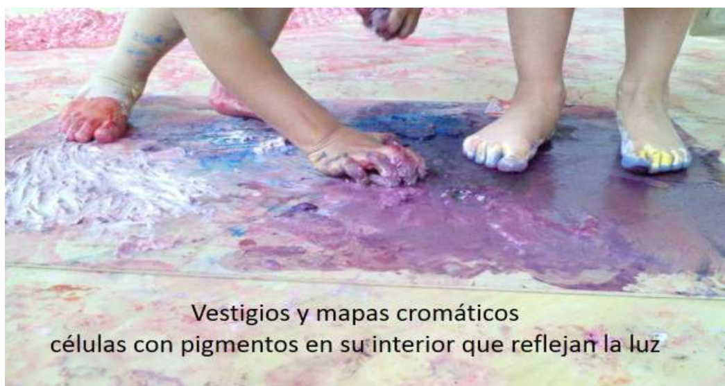
Vestigios y mapas cromáticos células con pigmentos en su interior que reflejan la luz

imagen que se mueve bajo él (en el espejo) no duda en seguirla por un buen rato, al parecer tratando de atraparla.