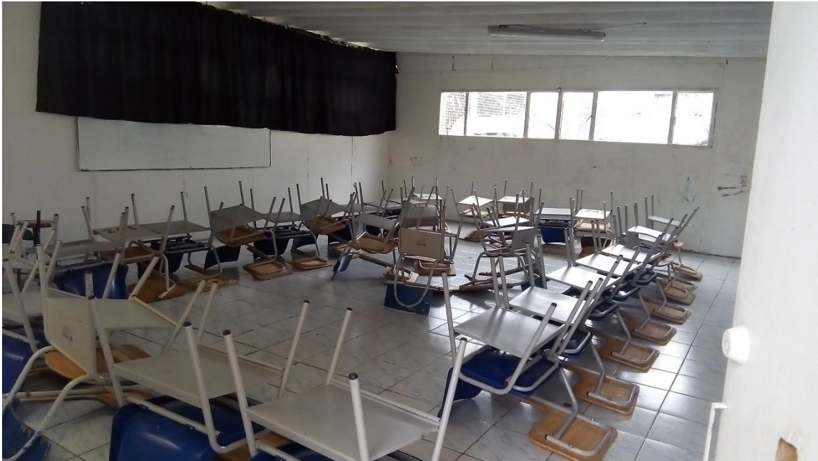
Instalación pedagógica 1 "Patás Arriba"