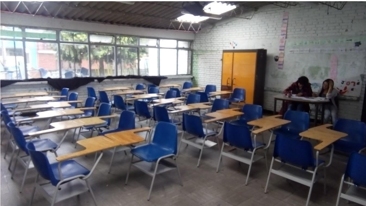
Instalación Pedagógica 2 “Confrontación”

Bueno por lo menos en este caso yo podría controlar el olor, pidiéndole en la próxima clase al personal de aseo que por favor no cocinaran de 10:30 am a 12:15 pm. Eso me tranquilizó bastante pero lejos estaba de saber que el olor no sería el único inconveniente que tendría.