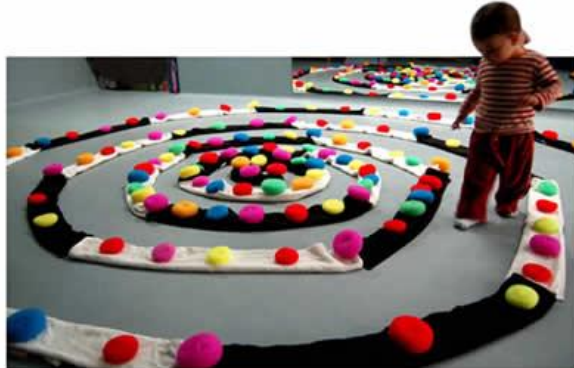
(Abad, Un jardín, una ciudad, un mapa, una piscina )