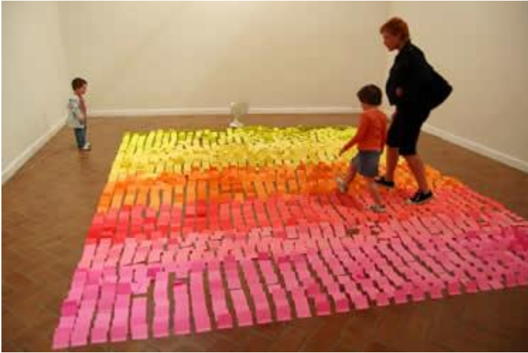
(Abad, Intervenciones Lúdicas)