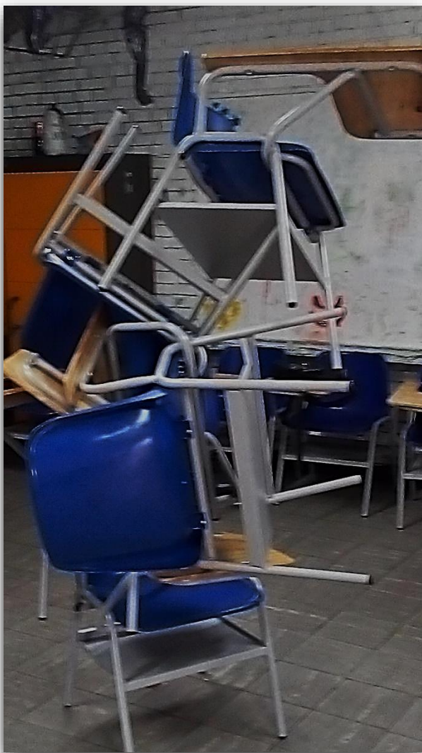
Instalación Pedagógica 3"Equilibrio y Peso"

Bien, bien, muy bien. Creo que logre la articulación perfectamente entre los conceptos y los objetivos, utilizando como dispositivo de mediación el espacio físico, específicamente los pupitres, logré articular el cuerpo del grupo activamente y además logré que se relacionaran de una manera más cordial y amena. ¿Y la topofilia? Bueno, si bien no puedo decir plenamente que ahora quieren más su salón, al menos no lo odian. ¿Será que no? O tal vez la actividad estuvo tan focalizada en la relación con el otro y la otra que no tuvieron tiempo para interactuar con el espacio. Al fin y al cabo siempre estuvieron en las sillas. ¿Cómo se reconoce un lugar? ¿Qué se necesita para hacerlo? ¿Reconocer es igual a querer? Bueno al menos ya tengo en qué pensar en toda esta semana.