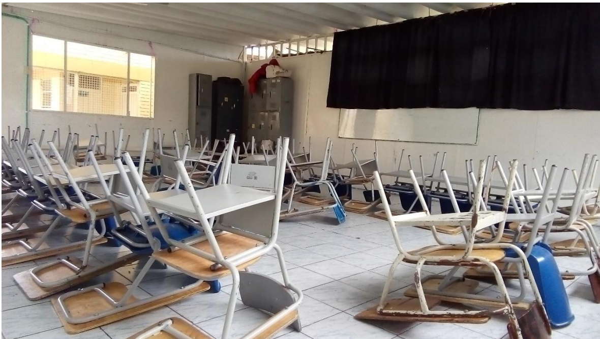
Instalación Pedagógica 1 "Patás arriba".