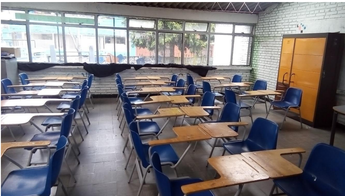
Instalación Pedagógica 2 “Confrontación”