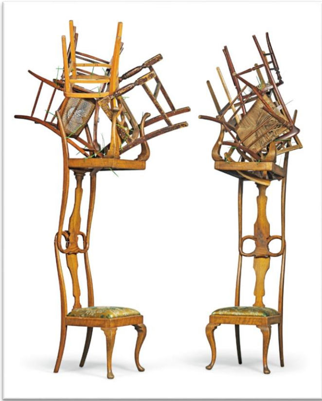
"In The Woods' a Chair" 2009 (Ryan)