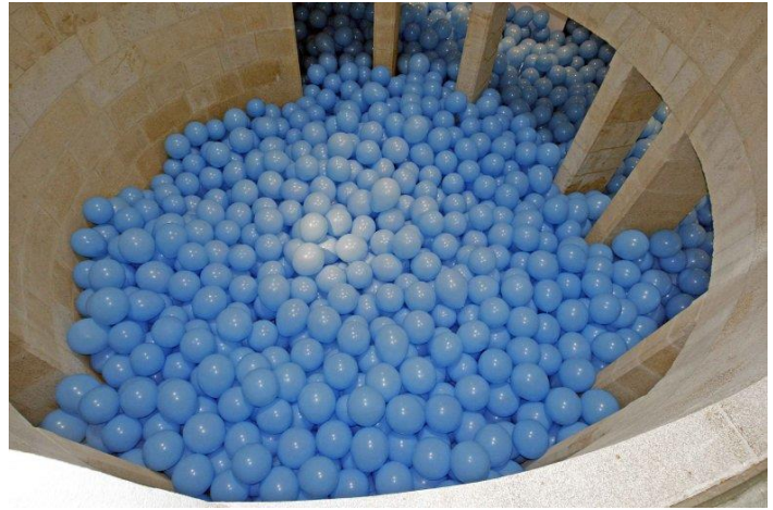
“247 Half the air in a given space” (Creed)